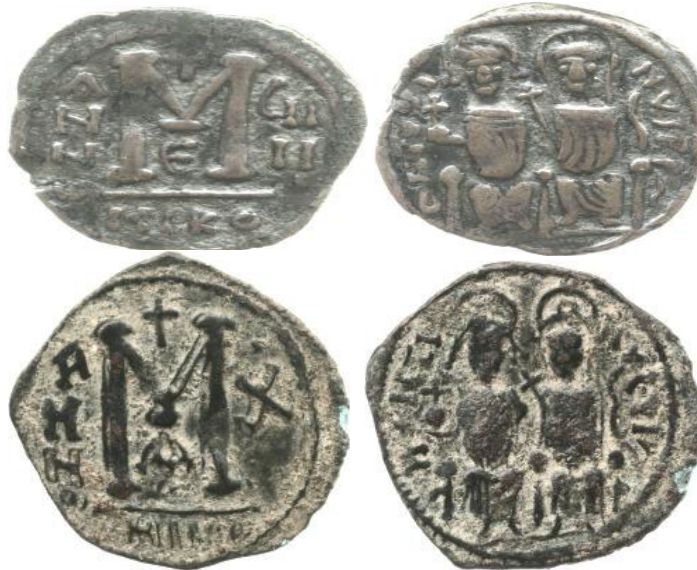
سکه تقلیدی، تصویر یوستین و همسرش سوفیا را دارد (Pottier, and Foss, 2004: 287)

نمونه‌ای از سکه‌های برنزی که در زمان فرمانروایی ساسانیان در سوریه ضرب شده است.