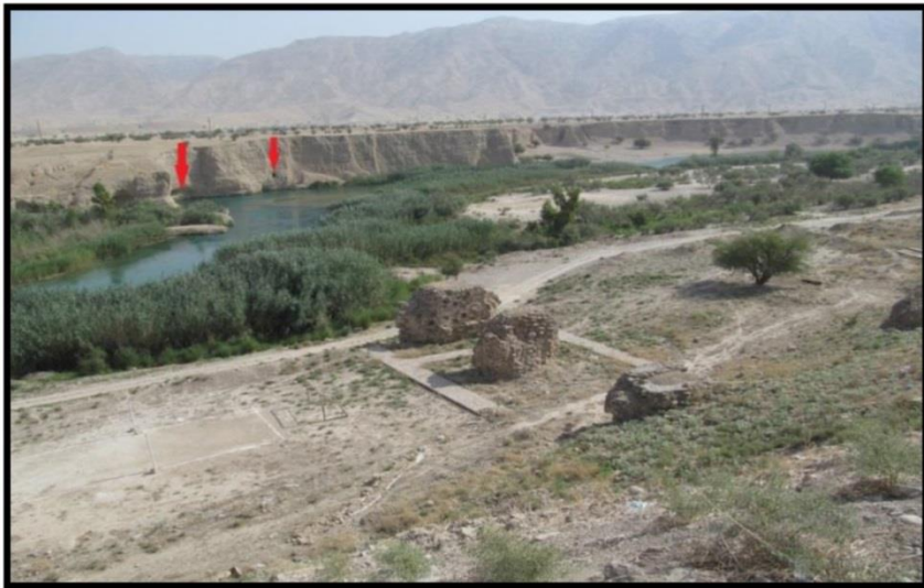
تصویر ۳. پل بند ارجان، محل انشعاب قنات‌ها از رودخانه (ر.ک. نگارندگان).

موقت نیز از آنجا به سمت بهبهان کوچ کردند. رشد بهبهان موجب فراموشی ارجان گردید و تمامی ظرفیت‌های ارجان در قالب شهر بهبهان به کار گرفته شد. در نهایت تمامی فعالیت‌های کشاورزی، تجاری و حتی مسیر جاده‌های ارتباطی به شهر بهبهان منتقل گردید و همین امر سبب شد که پس از آخرین دوره سکونت، ارجان هیچ‌گاه دوباره مورد استفاده قرار نگیرد. تأسیسات آبیاری ارجان تنقیه شد و مجدداً در شهرهای بهبهان و منصوریه به کار رفت. زمین‌هایی که شهر ارجان در آن‌ها قرار داشت، به زیر کشت غلات رفت و از ارجان جز نامی برجای نماند.