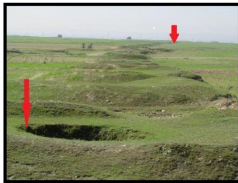
تصویر ۲. بخشی از سیستم آبیاری ارجان (ر.ک. نگارندگان)